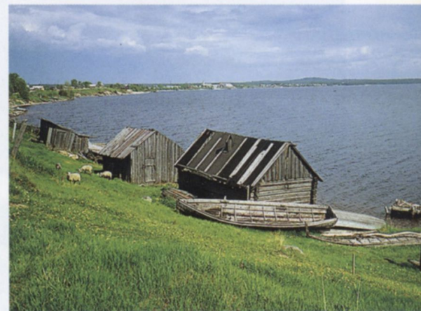
Mestarin jäljillä Vienan- Karjalan Uhtuassa s.30